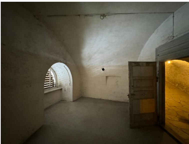
Raum mit Holzverschlag