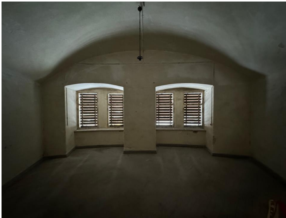
Raum mit Holzverschlag