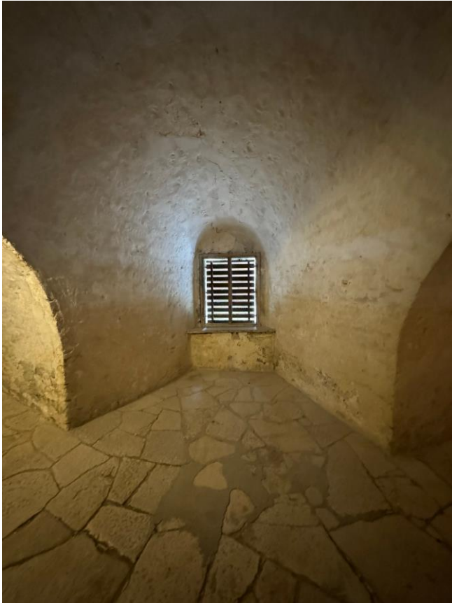
Raumnische im Aufgang © Thilo Endres