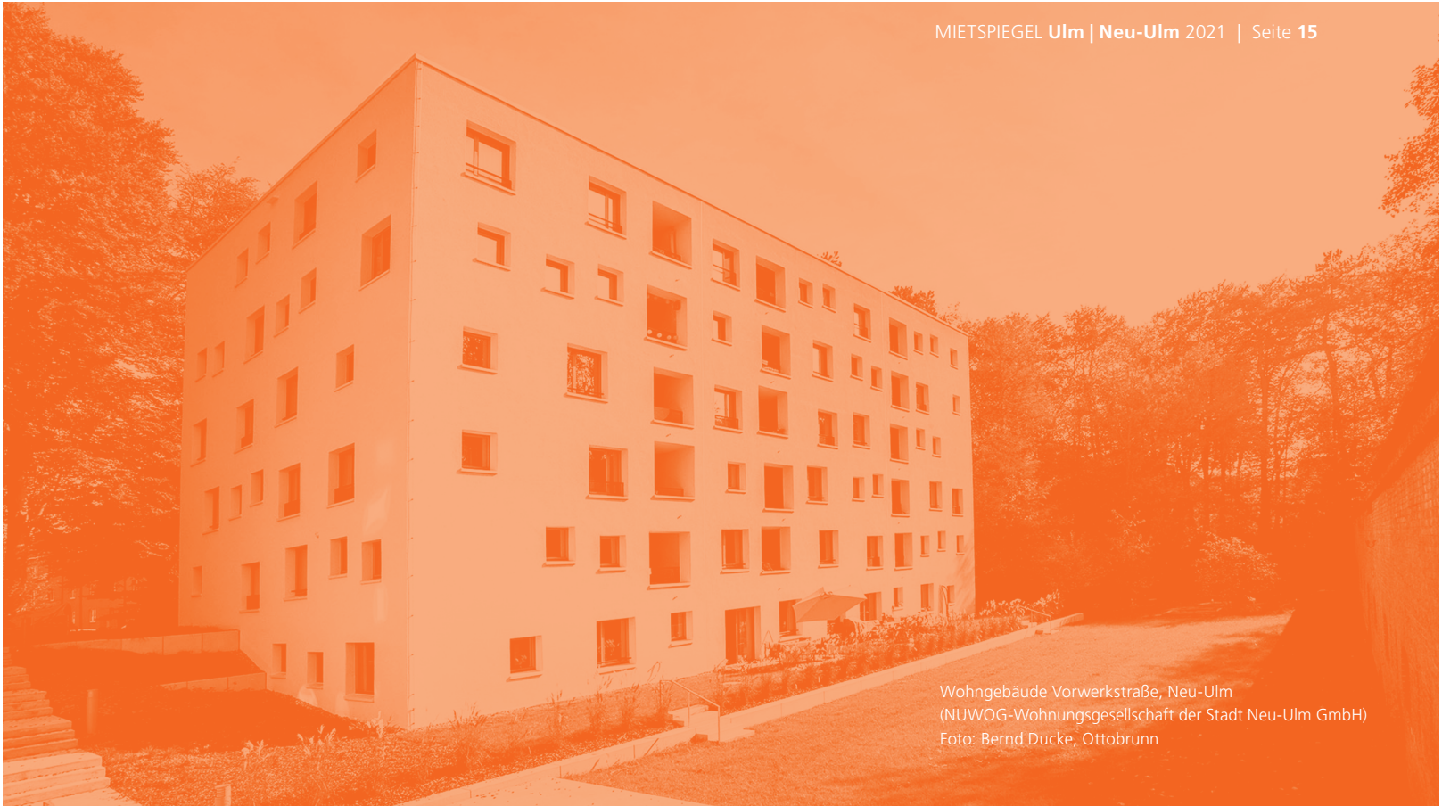
Wohngebäude Vorwerkstraße, Neu-Ulm (NUWOG-Wohnungsgesellschaft der Stadt Neu-Ulm GmbH)