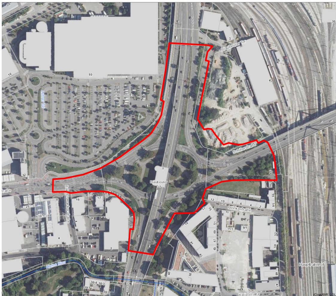
Abbildung 2: Luftbild mit Plangebiet (rot), o. M., Quelle: LUBW

chen der Bahn. Weiter östlich und nördlich verläuft eine breite Schienentrasse (zahlreiche Gleise, Güterbahnhof).