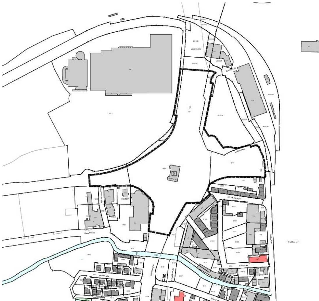
Abbildung 1: Lageplan mit Geltungsbereich, o. M.

Die Stadt Ulm plant aufgrund des Zustandes der Brückenbauwerke und des damit verbundenen Erneuerungsbedarfs der Bauwerke sowie der Planung der Landesgartenschau umfassende Infrastrukturmaßnahmen rund um den Verkehrsknoten B10/B28 am Blaubeurer Tor. Für die Umbaumaßnahmen soll ein planfeststellungseretzender Bebauungsplan aufgestellt werden. Das überplante Gebiet ist ca. 4,83 ha groß. Die Planung umfasst den Rückbau der Blaubeurer Tor-Brücke, die Tieferlegung der B 10 in einer Verschwenkung östlich des Blaubeurer Tors in einem Tunnel sowie die Öffnung des vorhandenen Straßenkreisels im südöstlichen Segment. Durch die Überdeckung der B 10 und die Öffnung im Südosten entsteht rund um das Blaubeurer Tor eine zusammenhängende Grün- bzw. Freifläche, die unmittelbar an das Dichterviertel angebunden ist. Zudem wird erreicht, dass das Blaubeurer Tor, das als Teil der Bundesfestung ein für die Stadtgeschichte sehr bedeutendes Baudenkmal darstellt, zukünftig wieder wesentlich besser zur Geltung kommt.